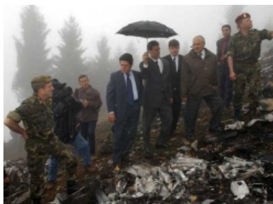
Trillo en la zona del accidente del Yak-42 en 2003.